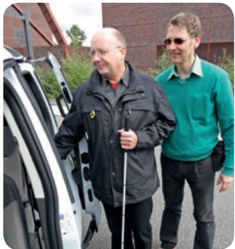
Unsere Blindenmobifahrer im Einsatz

Montag bis Freitag von 9:00–16:00 Uhr Einfach und unbürokratisch!