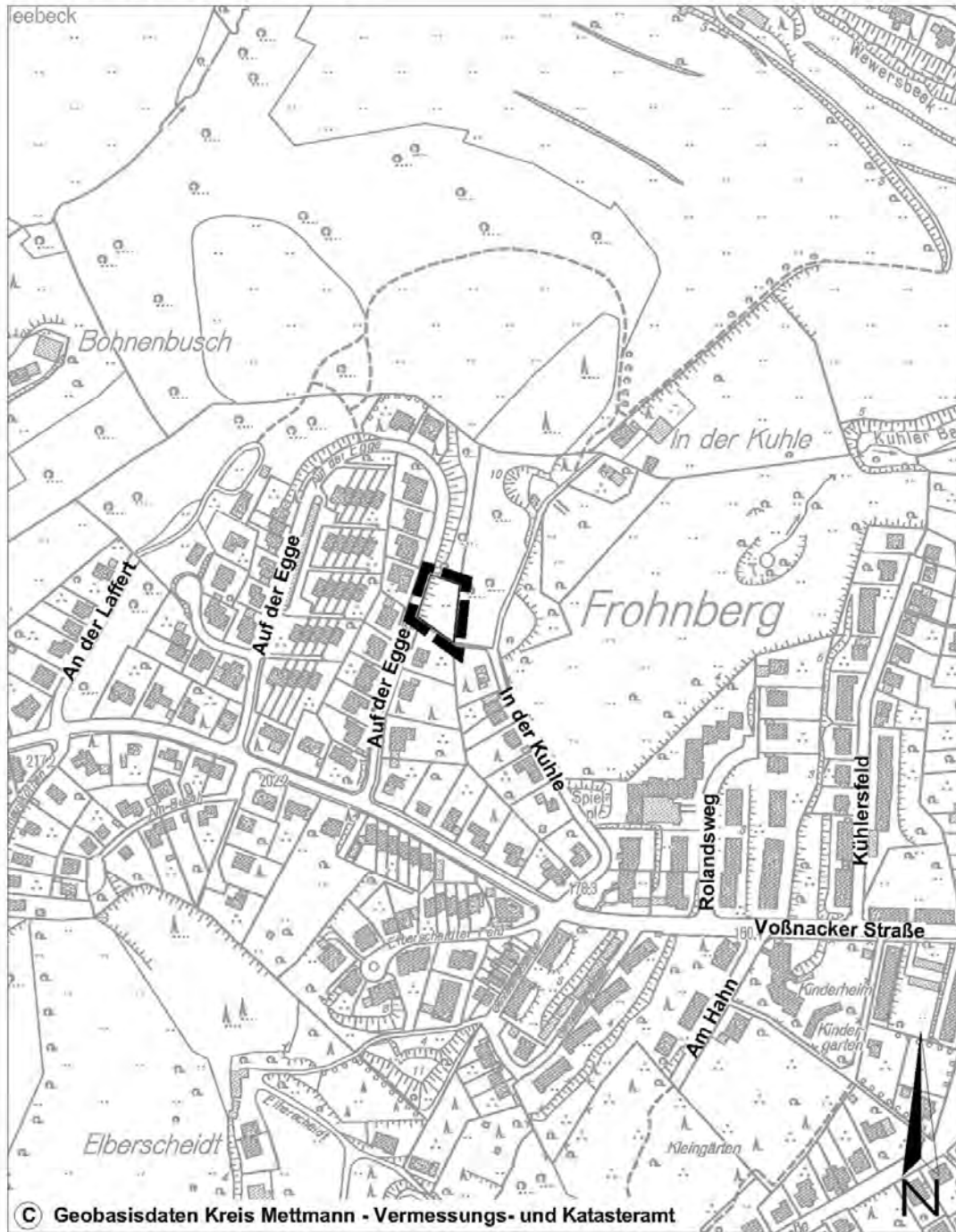
Bebauungsplangebiet Nr. 218 - Auf der Egge - 1. Änderung